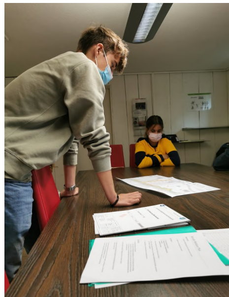
Die Theorie des Nivellieren anschauen, später dann auch noch draussen im Freien ausprobieren.

In sechs Gruppen mit je vier bis sechs Schüler und Schülerinnen, konnten die Kinder in diesen zwei Tagen jeweils für eineinhalb Stunden den von ihnen ausgewählten Beruf näher