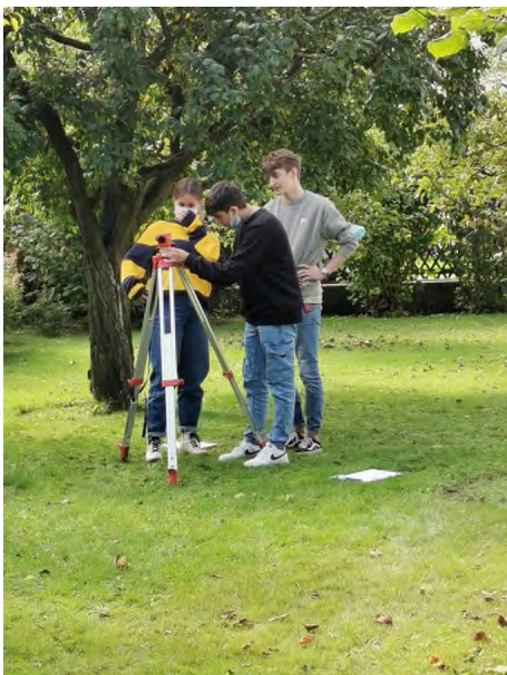
Die Schüler bauen das Nivelliergerät auf.

Die 2 Tage haben uns Lernenden wirklichen Spass gemacht und es war eine grosse Freude den Schülern und Schülerinnen unseren Beruf näher zu bringen. Wir hoffen nur das Beste und wünschen allen eine gute Berufssuche!