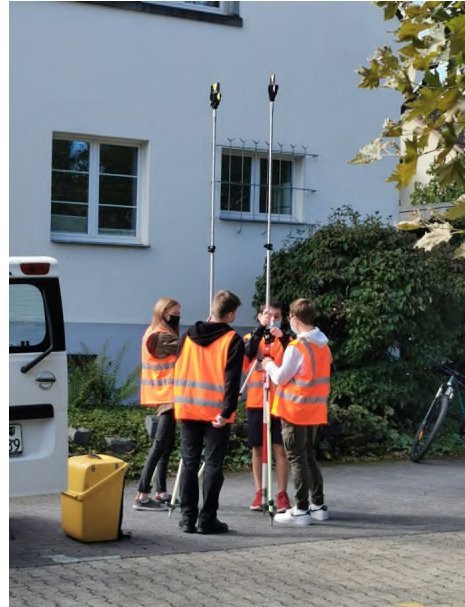
Die Geomatiker schauen sich Mess-Methoden an.

kennenlernen. Wir Lehrlinge haben die Schüler betreut und ihnen unseren Beruf nähergebracht. Die Schüler waren an unseren Tätigkeiten draussen mit den Messinstrumenten und dem Zeichnungsprogramm (CAD) auf dem Computer sehr interessiert und machten neugierig mit. Sie mussten mit dem Nivelliergerät und mit dem Tachymeter Aufnahmen machen, welche sie danach selber auswerten konnten. Die Schüler haben in diesen 2 Tagen sehr gut mitgemacht und sehr spannende Fragen gestellt, die wir selbstverständlich gerne beantworteten.